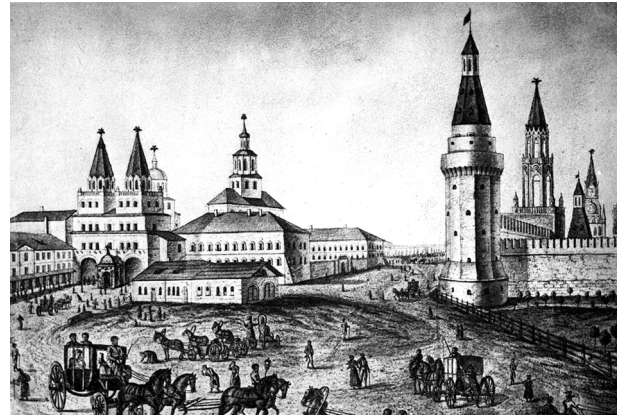
Рисунок 1. Здание Аптекарского дома – первое здание Московского университета Figure 1. The building of the Pharmacy House – the first building of Moscow University

При обсуждении 7 мая 1938 г. на заседании Совета МГУ вопроса «О генеральном плане капитального строительства МГУ» состояние Университета охарактеризовано как очень тяжёлое: «в университете 4413 человек, невозможно разместить 181 учебную группу в 75 аудиториях (даже при двухсменных занятиях), техническое состояние зданий и коммуникаций неудовлетворительно. В перспективе контингент должен составлять 9000 человек, соответственно, более чем в 2 раза не-